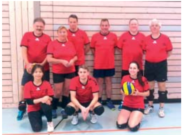
Am 3. Spieltag der Pokalrunde 2019

(red) Nachdem die Halle im Sportzentrum Sulzbach am Quierschieder Weg am 27.07.2020 wieder geöffnet wurde, konnte die Volleyball-Mannschaft der DJK Hühnerfeld ihren Trainingsbetrieb wieder aufnehmen. Wegen der Corona-Pandemie wurde das Sportzentrum Anfang März geschlossen. Die VolleyballerInnen der DJK Hühnerfeld stellten in der Folge ihren Spielbetrieb ein. Die im Januar 2020 gestartete Meisterschaftsrunde wurde abgebrochen. Erst Ende Juni konnte die Mannschaft in der Halle einer befreundeten Mannschaft wieder Volleyball spielen. Die gemischte Volleyball-Mannschaft der DJK Hühnerfeld spielt im Breiten- und Freizeitsportbereich (BFS). Dort hat sie im Jahr 2019 an der Meisterschaftsrunde und an der Pokalrunde teilgenommen. Wegen der Corona-Pandemie wird die Pokalrunde 2020 nicht ausgetragen. Die Wiederaufnahme der Meisterschaftsrunde ist noch unklar. Das Training der Volleyballmannschaft der DJK Hühnerfeld findet freitags von 20 bis 22 Uhr im Sportzentrum Sulzbach statt. Entsprechende Hygiene-Maßnahmen werden beachtet. Die Übungs- und Spieleinheiten werden von einem Trainer geleitet. Wer die Mannschaft verstärken will kann gerne im Training vorbeischaun. Weitere Infos gibt es unter Tel. 0151 44243585. ■