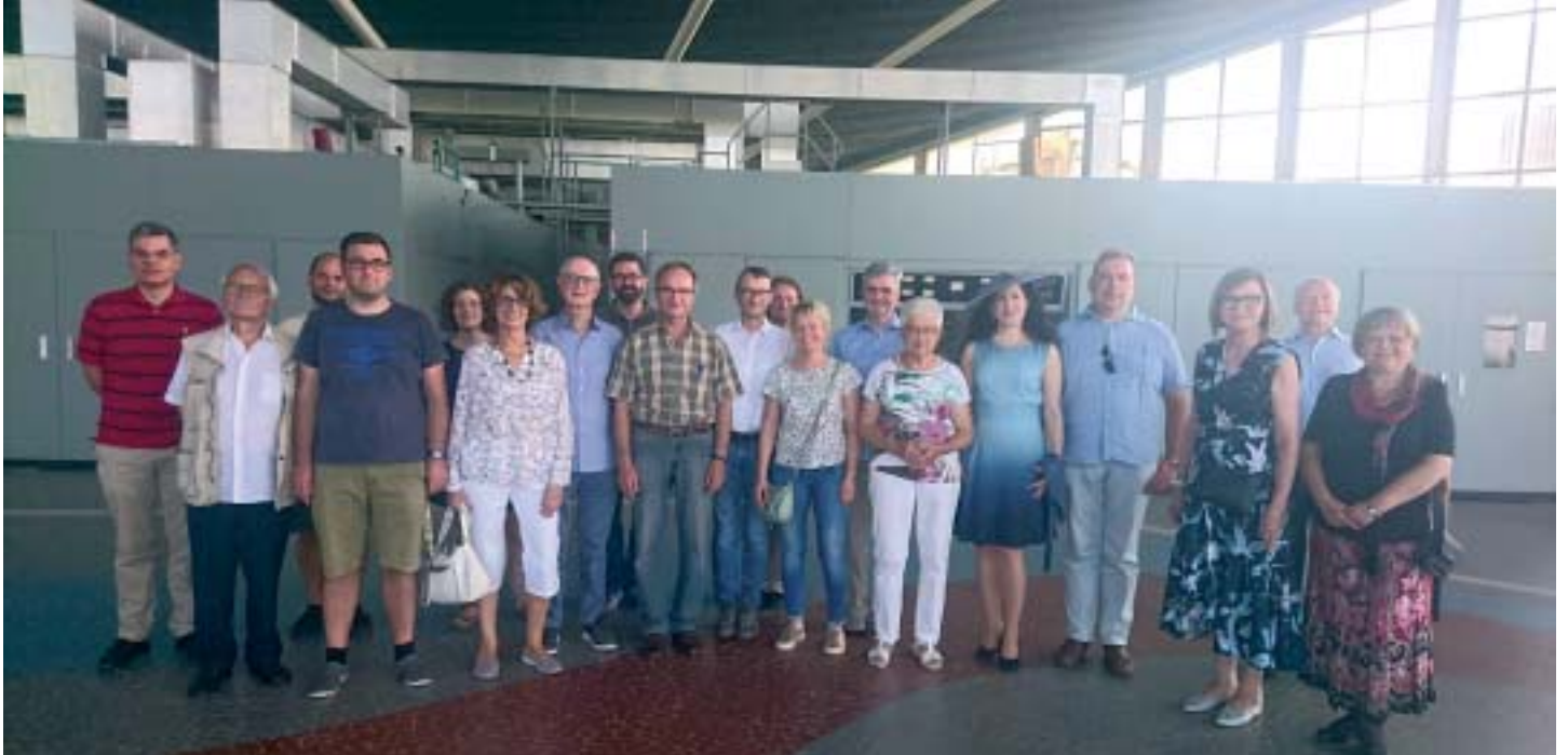
Mitglieder des Fördervereins besichtigen 2019 das Gebäude des ehemaligen Senders Europe 1 in Überherrn, © Historisches Museum Saar, Michelle Schneider

(red) Der Förderverein für das Historische Museum Saar e.V. wird am 5. September 2020 den Europäischen Kulturpark Bliesbruck-Reinheim besuchen. Die exklusive Führung erfolgt durch den Museumsleiter vor Ort, Dr. Andreas Stinsky. Neumitglieder des Fördervereins und bestehende Mitglieder können sich dazu ab jetzt unter info@hismus.de anmelden.