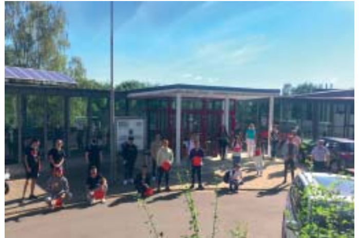
Schüler/innen des BVJ-1 und Lehrkräfte des BBZ Sulzbach.

Durchschnittsnote von 1,0. Überhaupt war in diesem Schuljahr aufgrund von Corona so vieles anders und gleichzeitig haben die Schülerinnen und Schüler ein unglaubliches Durchhaltevermögen und ein hohes Maß an Flexibilität bewiesen, als es darum ging, sich schnell an die neuen Anforderungen anzupassen, die mit den wechselnden Phasen aus Präsenz- und Onlineunterricht verbunden sind. Jetzt dürfen sie sich erst einmal auf sechs Wochen Sommerferien freuen, bevor es im neuen Schuljahr weitergeht.