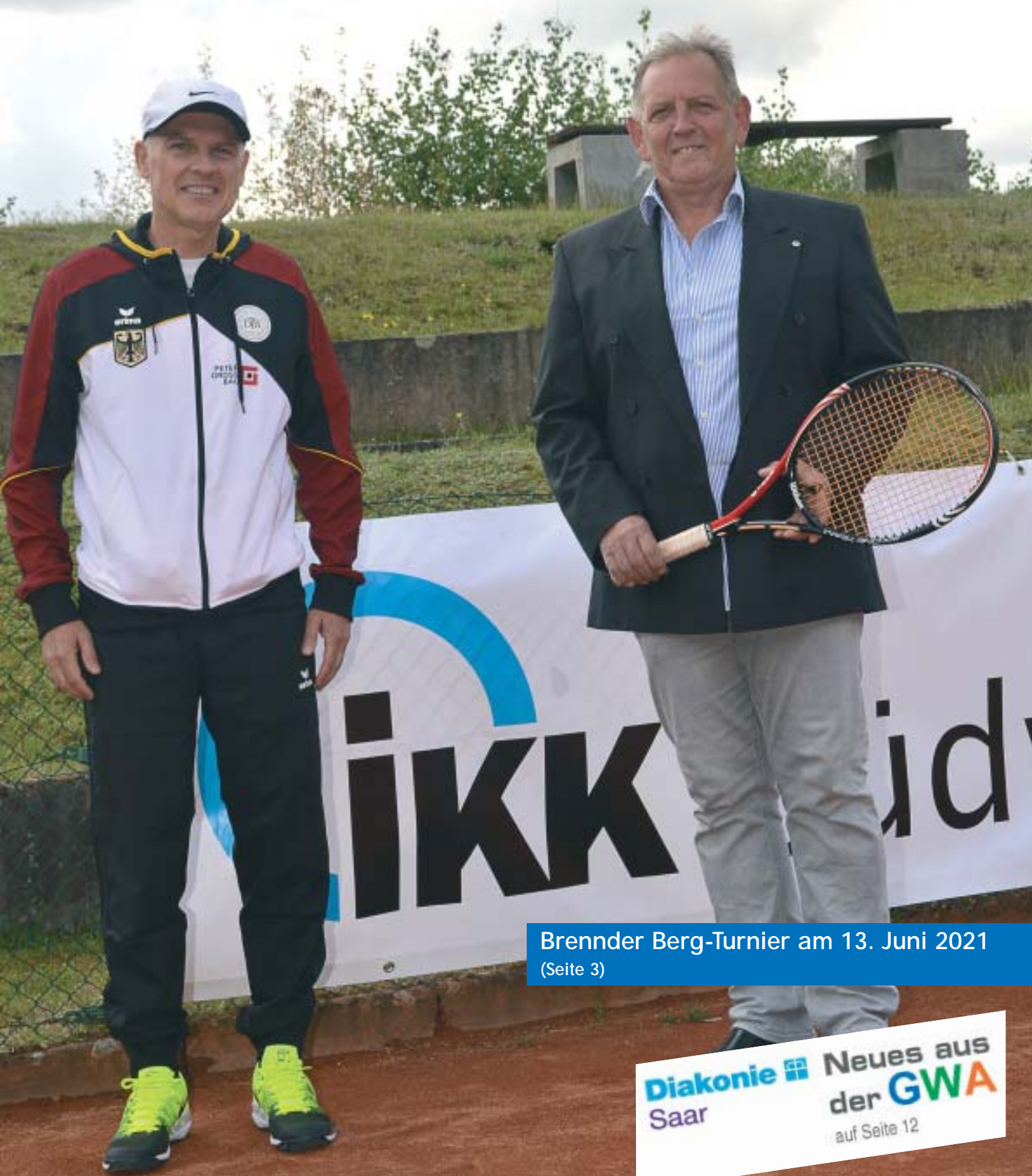
Brennder Berg-Turnier am 13. Juni 2021 (Seite 3)