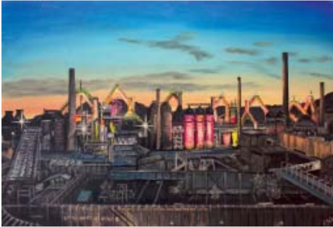
„Völklinger Hütte bei Nacht“

Gemälde saarländischer Industriekultur beim Tag der deutschen Einheit