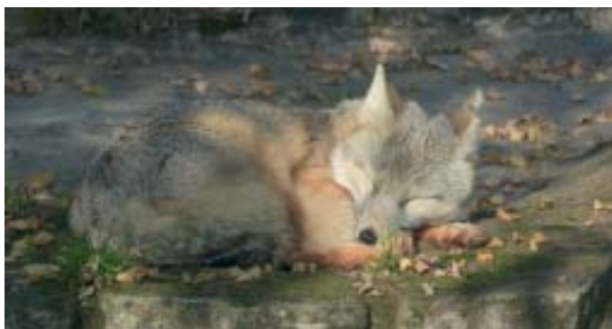
Steppenfuchs, Foto: Ronald Hens

Weitere Informationen gibt es im Internet unter www.zoo.saarbruecken.de .