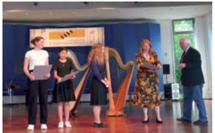
Auf dem Foto: Schülerinnen der Musikschule Chun, die erfolgreichen Kursteilnehmerinnen und Erstpreisträgerinnen bei "Jugend musiziert" des Landeswettbewerbs