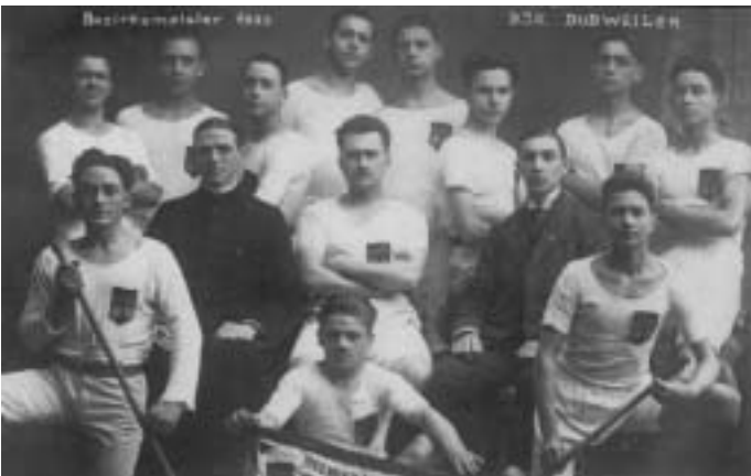
Schlagballmannschaft Bezirksmeister 1923